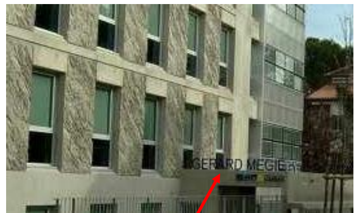
Bât Gérard Mégie (nom en contrebas)